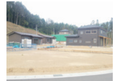
〈雄勝地域〉大浜地区

災害が発生した低平地の区域を、高台や内陸部へ集団で移転するために住宅団地を整備しています。また、移転元地は、産業等の場として再生することを検討しています。