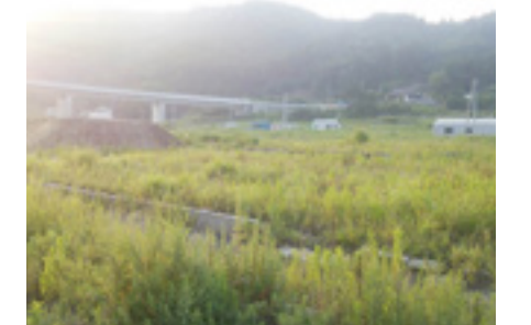
〈雄勝地域〉水浜地区