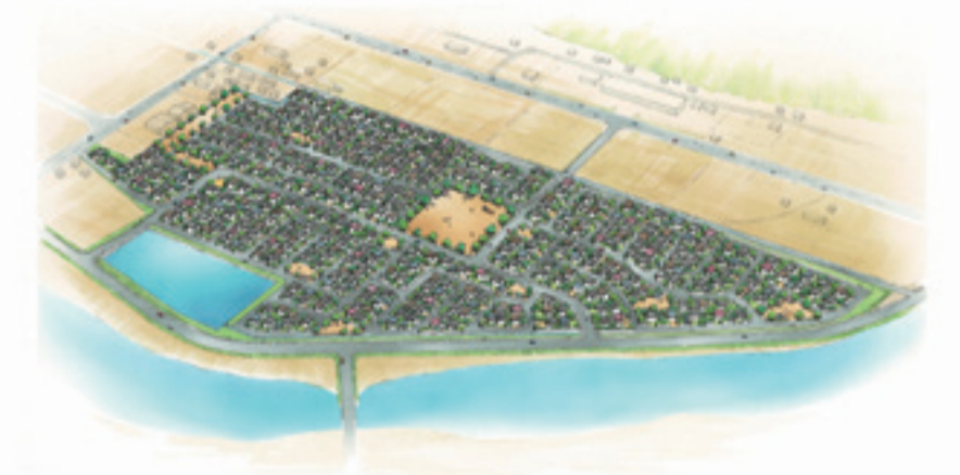
河北地区イメージ図