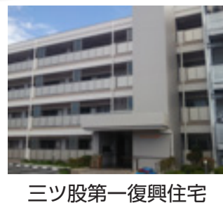
三ツ股第一復興住宅