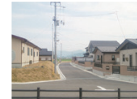
〈北上地域〉釜谷崎地区