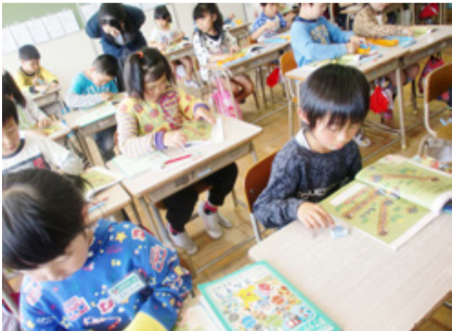
▲飯野川一小と二小の児童たちの交流授業