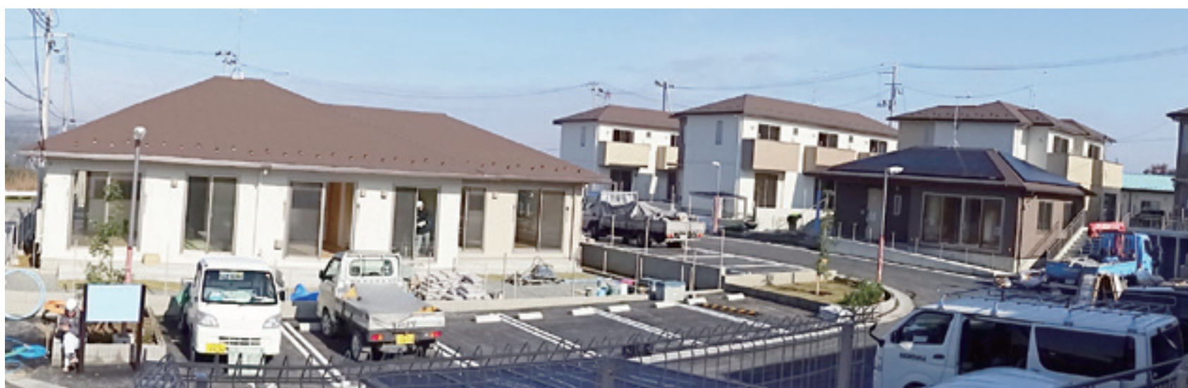
12月下旬の完成検査に向けて工事が大詰めを迎えています。入居予定者の見学会も行われました。(11月撮影)

現地見学会では「思っていたより広々としていて嬉しい」等の感想を話し合いながら、和やかな見学会となりました。(11月撮影)