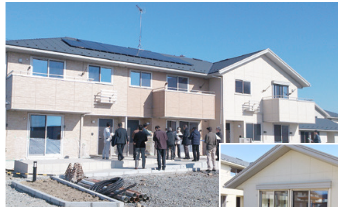
11月22日(土)市震災復興推進会議の委員による現地視察が行われました。(11月撮影)