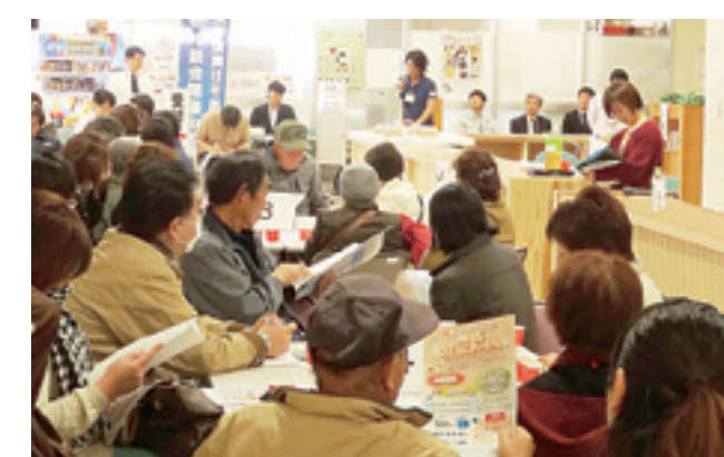
11月22日(土) 市役所5階市民サロン前