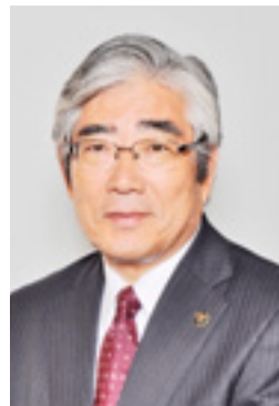
石巻市長 亀山 紘