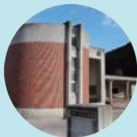
震災遺構大川小学校