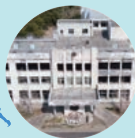
震災遺構門脇小学校