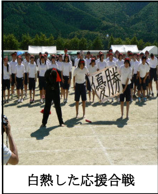
白熱した応援合戦

9月1日(土)「全力～運動会の歴史に残る1秒を刻もう～」をスローガンに、運動会が盛大に行われました。