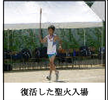
復活した聖火入場

P T A 役員の皆さんには、来賓接待や駐車場の整理等のご協力もいただきました。