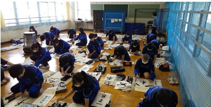
1年生の練習の様子