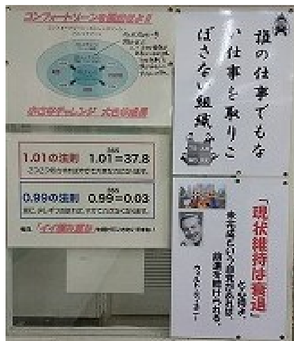
担任の熱い思いが伝わる掲示物