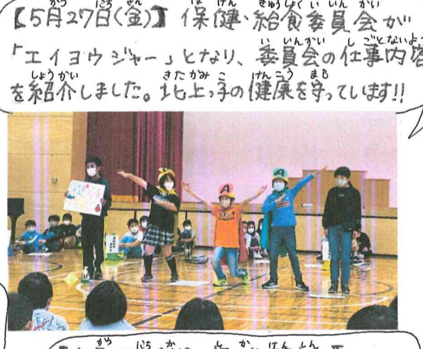
【5月27日(金) 保健給食委員会】 「エイヨウジャー」となり、委員会の仕事内容を紹介しました。北上の子の健康を守っています!!