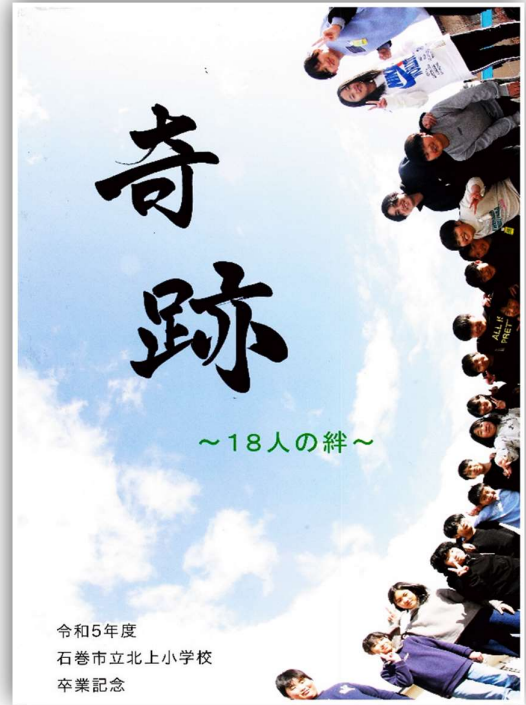
令和5年度 石巻市立北上小学校 卒業記念

最後になりましたが、6年間、本校の教育活動へ多大なる御協力を賜りまして誠にありがとうございました。お子さん方の今後のさらなる活躍を期待しております。