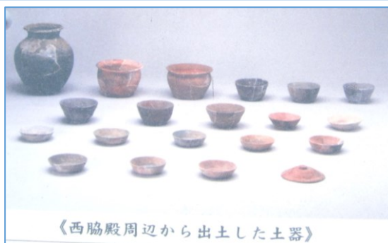
《西脇殿周辺から出土した土器》