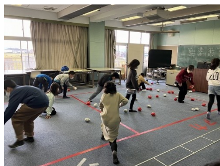
5班 ばくだんゲーム