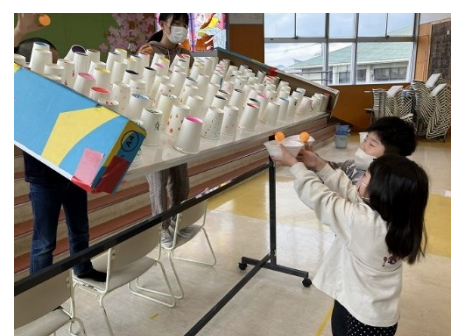
6班 ピンボールキャッチ