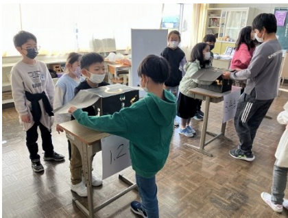
1班 はてなボックス

11月24日（金）スペシャル縦割り班活動を行いました。縦割り班ごと高学年を中心に班ごとに店を考え、協力して準備を進め、一人一人が割分担をしっかりとて、楽しんでもらえるよう頑張る姿が見られました。どの店でも子どもたちがとても楽しそうに遊んでいる姿が印象的でした。