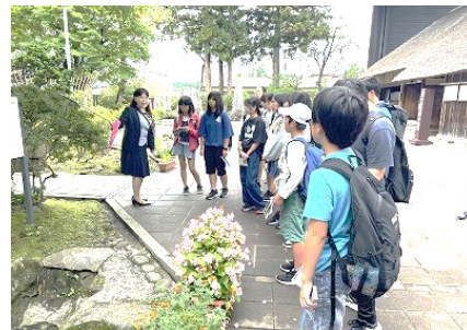
「野口英世記念館見学」