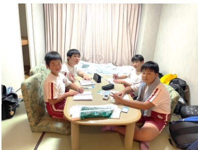
「ホテルリステル猪苗代」