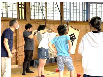
「会津藩校日新館見学」