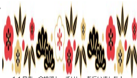
11月末・全校でトーチリレーを行いました！

笑顔で1年を締めくくることができるのは、保護者の皆様、地域の皆様の御理解と御協力に支えられているお陰です。来年も、夢と感動を共有できる、みんなが楽しい学校づくりに、教職員一同、全力で取り組んでいきたいと思っております。今後も、お力添えをいただきますよう、よろしくお願い申し上げます。どうぞよいお年をお迎えください。