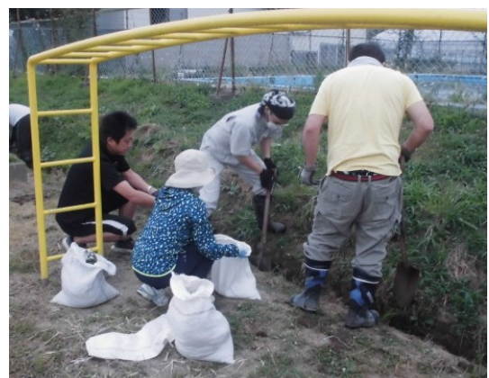
（側溝の泥上げの様子）

新型コロナウイルスの影響でなかなか父母教師会の活動ができない状況の中，ご協力をいただきまして，本当に感謝申し上げます。