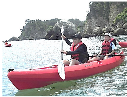
9/2 松島自然体験学習(5年)