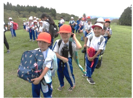
9/18 1年生も頑張って登ったよ