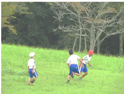
9/18 旭山への全校遠足