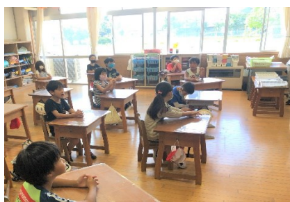
各教室で静かに聞いています。