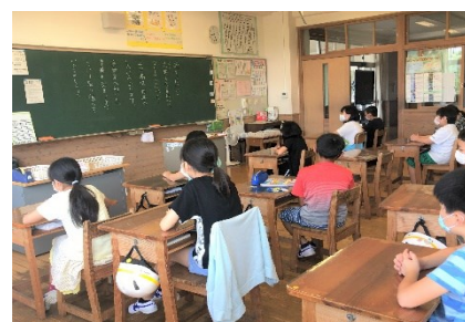
黒板には先生からのメッセージが