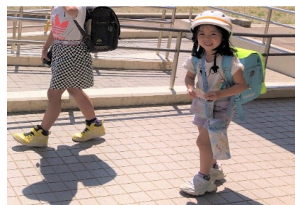
また明日ね！笑顔でさようなら