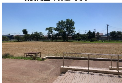
暑さ指数が高くて、休み時間は室内で過ごしました。