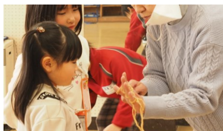
一緒にあやとりをしました

1月25日に1年生の生活科で「むかしの遊び」の学習を行いました。1年生の祖父母の方にお声をかけたところ、5名の方に御協力いただきました。学校にはない「輪投げ」や「パタパタおもちゃ」なども持ってきていただき、子どもたちは大喜び！半日一緒に楽しく遊びました。