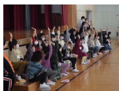
6年生のクイズに答えています