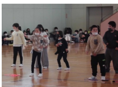
2年生はダンスでお迎えです