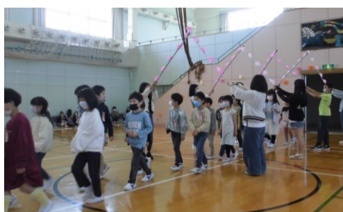
花のアーチをくぐって1年生が入場

5月2日、1年生を迎える会が開かれました。2～4年生は自分の学年の出番の時だけ講堂に入るという感染対策の中での実施でしたが、それぞれのお迎えの想いがあふれていました。これで34人が晴れて広瀨小の仲間入り。お兄さんお姉さん、よろしくね。