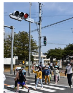
手を上げて、よく確認して