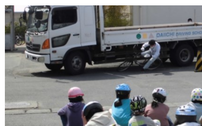
目を背けたいほどの衝撃!!

4月21日に交通安全教室が行われました。今年度はまず石巻第一自動車学校さんのご協力で、トラックによる自転車の巻き込み実験を見せてもらいました。迫真の演技と衝突音の激しさから子供たちからは悲鳴が上がるほどで、あらためて事故の恐ろしさを確認することができました。