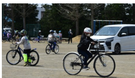
校庭に車を走らせて自転車練習

その後は学年部ごとに分かれて、道路の歩き方、横断歩道の渡り方、自転車の乗り方などを学習しました。警察署、交通安全指導隊、交通安全協会の皆様のご協力で、細かな部分までご指導いただきました。