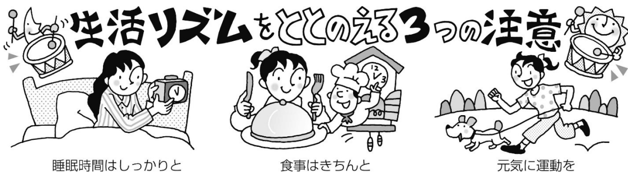
睡眠時間はしっかりと

いよいよ2学期がスタートしました。みなさんはこの夏休みをどのように過ごしましたか？今年の夏は暑い日が続き、学校のプールが開放できないという日も多くありました。2学期も学校行事がたくさんあります。早めに生活リズムを整えて元気に過ごしましょう。