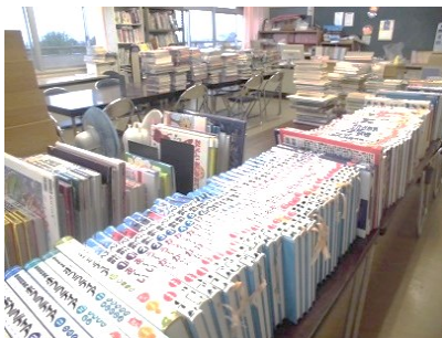
すごい数の本です