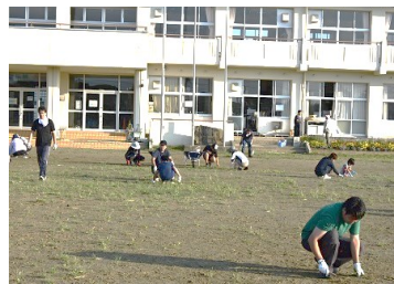
みんなで力を合わせて…

8月18日(日)早朝から暑い日であったにもかかわらず、多くの方々に集まっていただきました。子供たちが主に活動するトラック周辺にたくさん草が生えていましたが、大人と子供が力を合わせて黙々と作業する姿に感動しました。お陰様できれいになりました。みなさん、本当にありがとうございました。見違えるようになった校庭で、2学期も元気に学習や運動に取り組ませていきたいと思ひます。