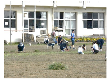
黙々と作業をしました