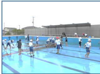
こんなにきれいに！

6月10日(月)、5、6年生がプールの清掃作業 をしました。今年の夏も快適にプールに入れるよう と子供たちは一生懸命でした。21日(金)には、見 違えるようにきれいになったプールで、「プール開き」 を行い、さっそく26日(水)に低・中学年の子供た ちが今シーズン初のプール学習を楽しみました。