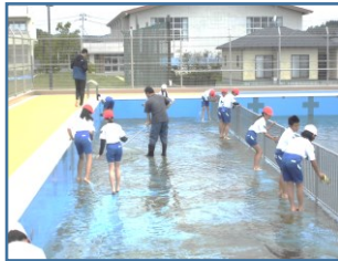
汚れていたプールが…