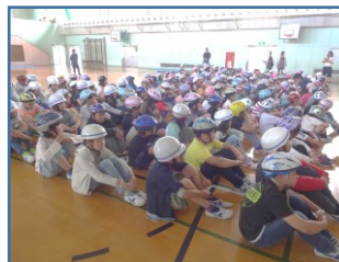
しっかり話を聞いています

また、避難訓練後に行った「引渡し訓練」でも、無事に子供たちを家庭に引き渡すことができました。皆様のご協力に感謝します。