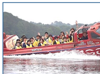
ボート体験（桧原湖）