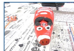
名物赤ベコ（児童作品）