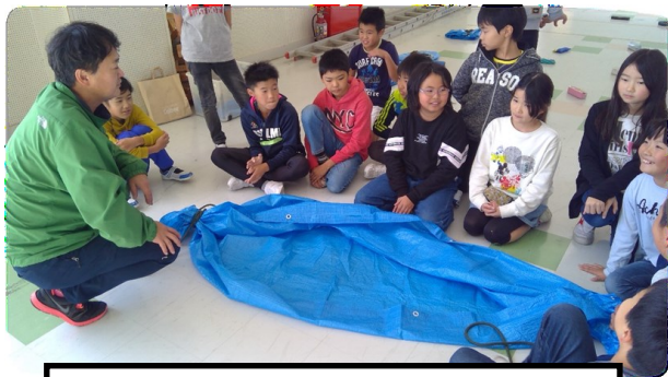
5年生 「自助の意識を高める」 ブルーシート寝袋訓練、 ポリ袋非常食体験 など