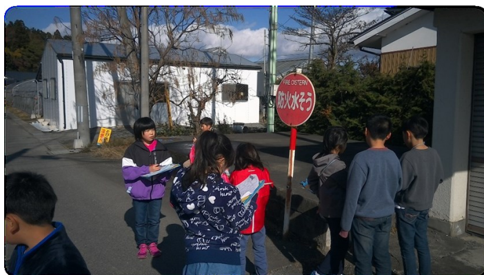
4年生 「広瀨地区の防災設備を知る」