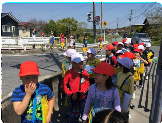
3年生 「広瀨地区の安全な所や 危険な所を知る」

今年度から3年生以上の総合的な学習の時間に、防災教育を10時間計画しました。発達段階に応じた防災教育の学習を設定し、1年1年防災についての知識やスキルを身に付けていくという目標の下、取り組んでいます。1・2年生は、生活科の「町歩き」や「昔遊び教室」等の学習を通して、地域の方と触れ合うことで広瀨について知っていくという活動を行いました。スパイラル的に学んでいくことが、「未来へつなぐ私たちの町・広瀨」につながっていくことを期待しています！