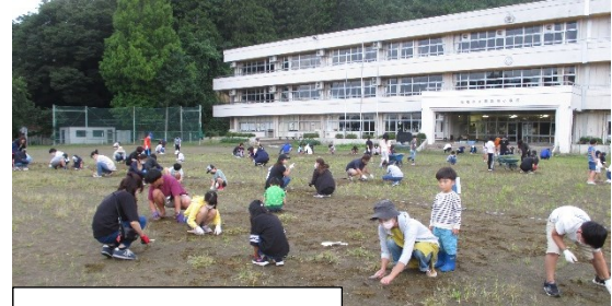
親子奉仕作業の様子