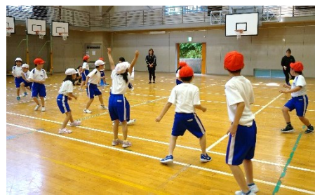
お父さん・お母さんと一緒に いい汗をかきました

お子さんの一人から「いつもは小さい弟や妹のお母さんだけど、この日は僕だけのお母さんだった」と幸せそうな笑顔で感想が聞こえてきました。