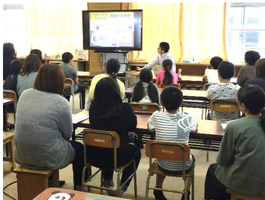
薬物乱用防止教室の様子

「軽い気持ちで薬物に手を出してしまうと、快楽からその量がしだいに増えること」「薬を続けているといつしか幻覚が見え始め、その幻覚から逃げるために自殺してしまうケースがあること」等を学びました。