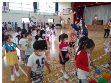
風船や紙吹雪に歓声を上げて退場する1年生の子供たち。