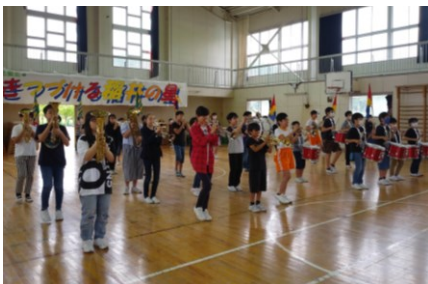
6年生は、指揮者をはじめ、様々な楽器を一人一人が責任をもって演奏していました。

児童は、日々の学習活動とともに、様々な行事とおして成長していくものであると改めて確認する場となりました。まだまだ、3密に気を付けながら制約のある状況ではありますが、一人一人の児童を大切に教育活動を展開していきたいと考えています。