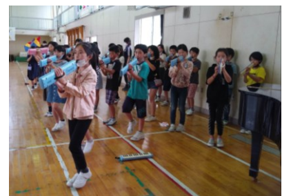
鍵盤ハーモニカを演奏する5年生。緊張しながらもしっかり演奏していました。