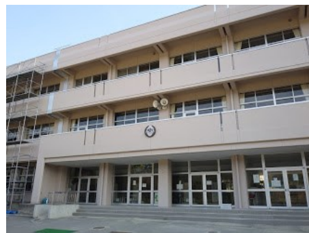
【校庭側の時計が新しくなります】