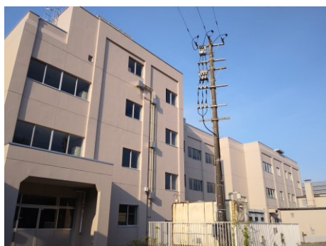
【校舎裏もきれいになりました】