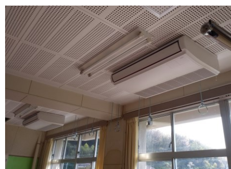
【教室には室内機が2台設置されます】