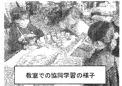
教室での協同学習の様子

異年齢集団のよさを生かして、縦割り遊びや縦割り遠足を実施しています。また、業間時間には「業間マラソン」などの運動を継続して実施しています。強い心と体を作ると共に、高学年への憧れや、低学年への優しい気持ちを育てています。