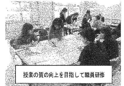
授業の質の向上を目指して職員研修