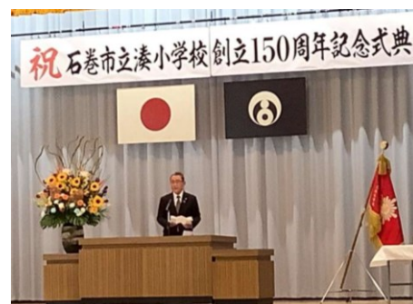
宍戸健悦教育長の祝辞