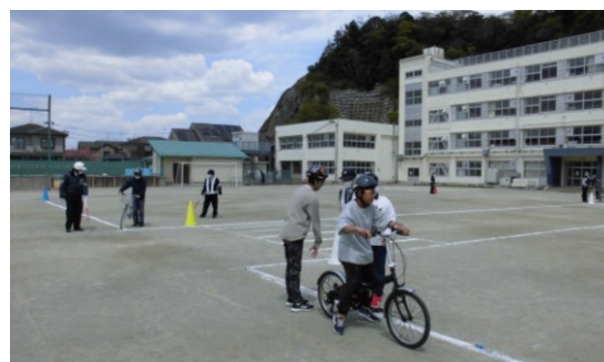
自転車走行訓練の様子

これから、本校では、ゴールデンウィークを過ぎると運動会の練習が本格的に始まります。今年度は、創立150周年記念を冠する運動会となります。昨年度より少しグレードアップした内容を予定しております。さらに、コロナウイルス感染症が5類へと移行することに伴い、今のところですが、特に制限を設けずに実施できる見込みです。