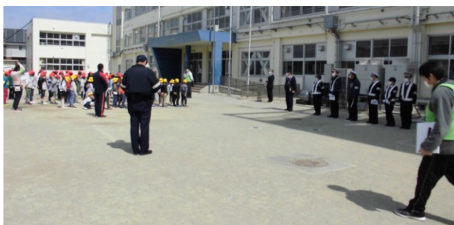
交通安全教室「開会式」の様子

さて、今週の24日（月）に、湊交番の警察官、交通指導隊の方々にお出でいただき春の交通安全教室を実施しました。1～4年生は学区内の歩行訓練を、5・6年生は校庭で自転車の安全な乗り方について実技指導を受けました。