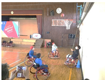
【あすチャレ!スクール①】