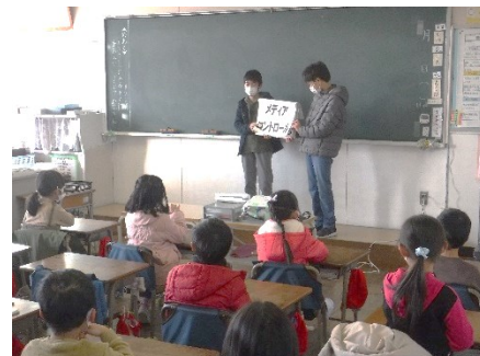
【若草集会(健康委員会)】