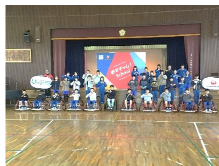
【あすチャレ!スクール②】