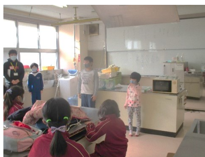
【特支学級交流会(石中にて)】