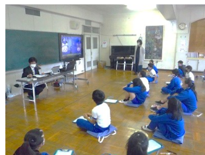
【情報モラル授業(4~6年)】