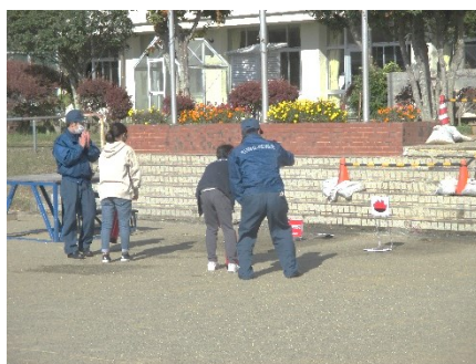
【火災想定避難訓練】