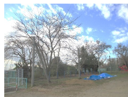
【南側樹木一部剪定・伐採】