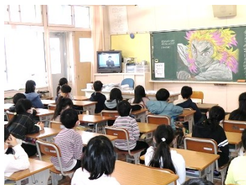
2年生しっかり聞いています。