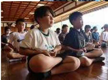
【写真：6年生修学旅行】