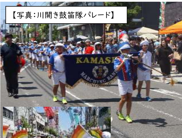
【写真：川開き鼓笛隊パレード】

夏休み中、学校では三者面談、水泳学習会(すべて中止となってしまいました。)、夏休み学習会を実施し、保護者の皆様との有意義な話合いや子供たちの学習のサポートができました。また、8月4日(日)には、6年生が川開き鼓笛隊パレードに参加し、堂々とした演奏を