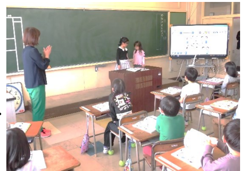
【学習参観 1年生の授業】

4月に一人一人の子供が胸に抱いた希望や期待に応えられるように、教職員一同力を合わせて指導してまいります。保護者の皆様や地域方々のご支援・ご協力をよろしくお願いいたします。