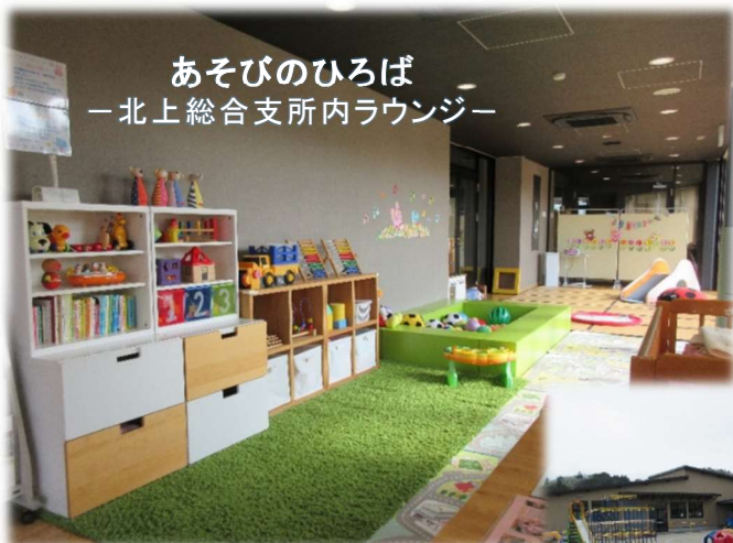
あそびのひろば —北上総合支所内ラウンジ—