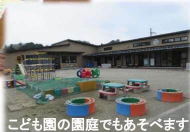
こども園の園庭でもあそべます