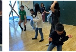
あ!この曲おどれるよ!