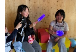
ペンライトを持ってきたこも!