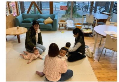
0才おやこみんなでまったり♡