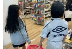
グッズの買い出し

後半はスポーツ室を暗くして、好きな曲流せる時間に♪一曲ずつ歌ったり踊ったりしていると、あっという間に終わりの時間になりました。参加者のこたちからは「またやりたい!」「次は自分も何かやってみたい」という声があり、企画者からは「みんな楽しそうでよかった」「準備物を工夫してまたやりたい」という感想がありました。