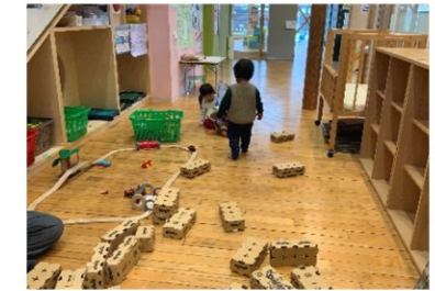
雨の日でもひろーくあそべるよ!