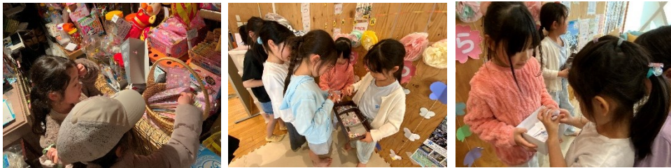
シールくじ用にジャンプで買い出し!シールくじ、大盛り上がりだったね!

企画者が考えた「シールくじ」も大盛り上がり!「おしりシールが当たった!」「もう1回やりたい!」とみんな大満足な様子。気が付けばあっという間の1時間でした。