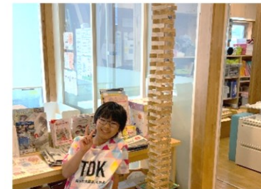
とっても高い!カプラタワー!