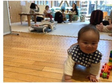
ママがゆつくりしてるあいだにおさんぽ☆