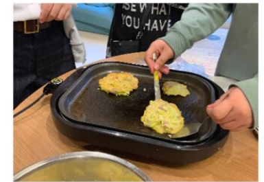
みんなでお好み焼き!上手だね!