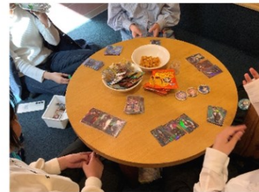
みんなと一緒に推しトーク!