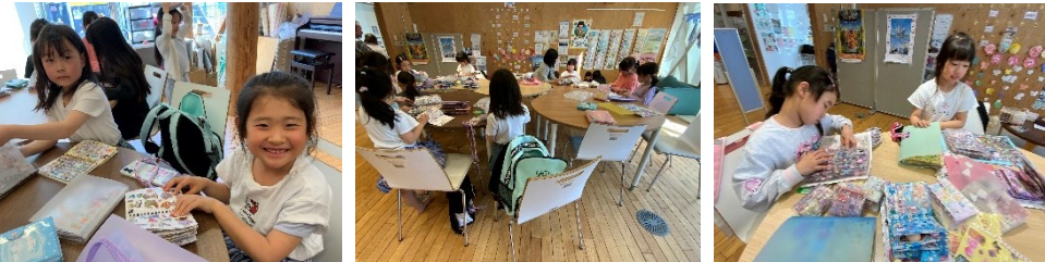
仲良しのこも初めましてのこもいっしょに、シール交換をまんぎつしました♪