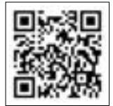
②ワンストップ特例制度（トラストバンク）