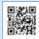
ふるさとチョイス

● ご入金方法 クレジットカードや電子マネー等で、お申し込みと同時に支払いいただけます。