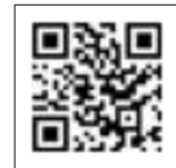
③自治体マイページ