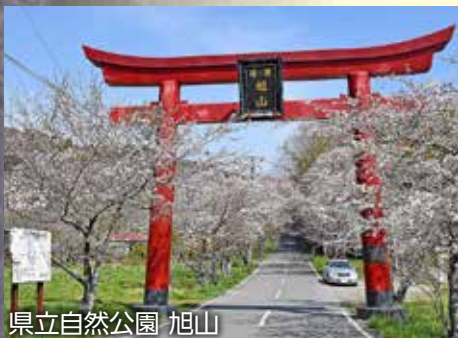
県立自然公園 旭山