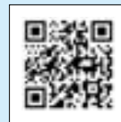
楽天ふるさと納税