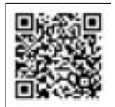
④書類様式・記入例