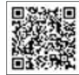
①ふるさと納税の仕組み（総務省）