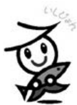
石巻市イメージキャラクター 「いしびよん」