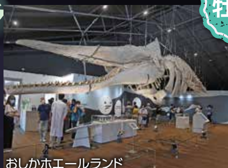
おしかホエールランド