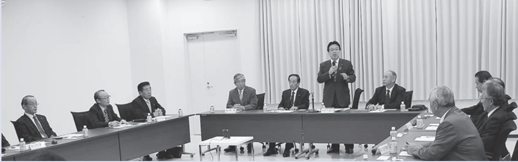
◀東部沿岸大規模被災市町議会連携会議発足会の様子

平成24年11月1日には、中央要望活動を行いました。また、平成24年11月20日には、宮城県議会へ大震災からの早期復旧・復興に向けての要望活動を行いました。