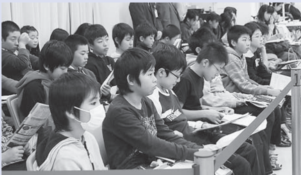
▲傍聴に訪れた山下小学校5年生のみなさん