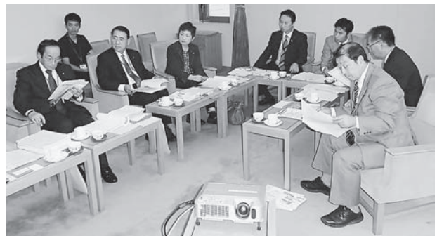
▲芦屋市役所 担当職員より説明を受ける

被災地である本市において、これらの取り組みについては、今後想定される課題であることから、先進事例として大変参考となるものであった。