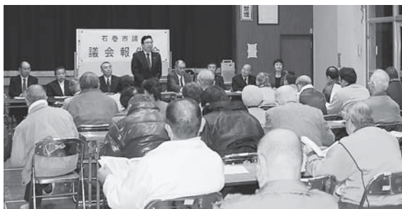
▲蛇田公民館での報告会の様子