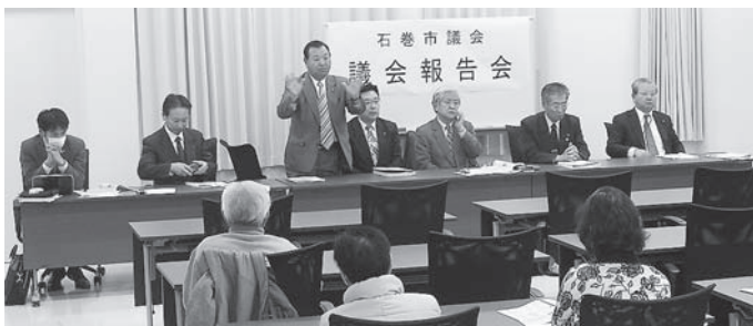
▲石巻市役所での報告会の様子