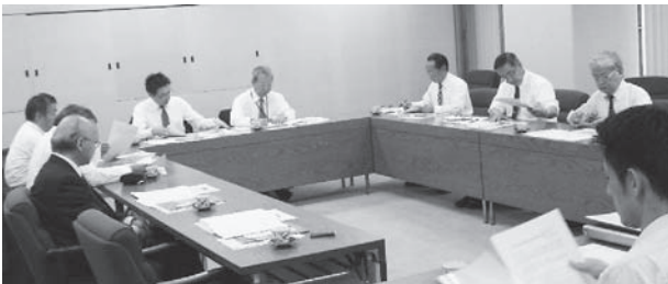
▲西宮市役所 震災からの復旧・復興について説明を受ける

岡崎市では、平成20年8月豪雨被害を教訓に、情報伝達の強化策としたデジタル防災行政無線の整備や防災ラジオの導入等を視察した。これらの取り組みは、東日本大震災において情報伝達や情報収集が課題となり、今後の整備が必要な本市にとって、大変参考となるものであった。