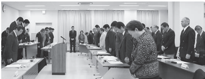
▲全員で哀悼の意を表し黙祷