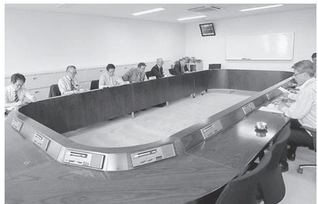
▲糸島市役所 担当職員から説明をうける

また、企業誘致において、九州大学を核とした学術研究機能を活用した先端企業の集積や新産業創出に向けた取り組みについて視察を行った。