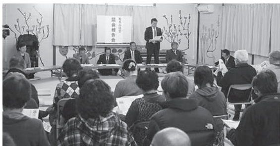
▲仮設開成11団地での報告会の様子