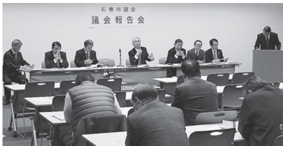
▲河南・遊楽館での報告会の様子