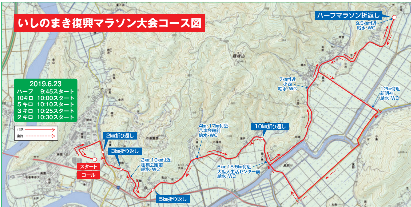
この地図は、国土地理院の電子地形図25000を使用したものである。