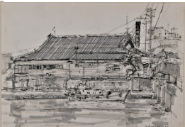
「劇場」 展示会場 旧観慶丸商店