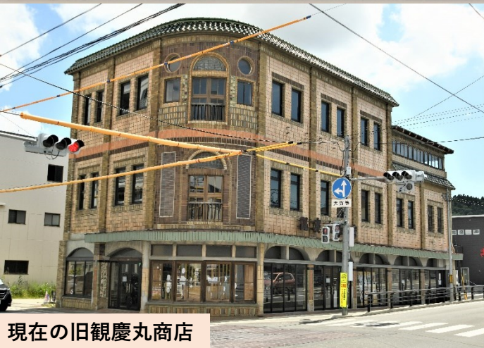
現在の旧観慶丸商店