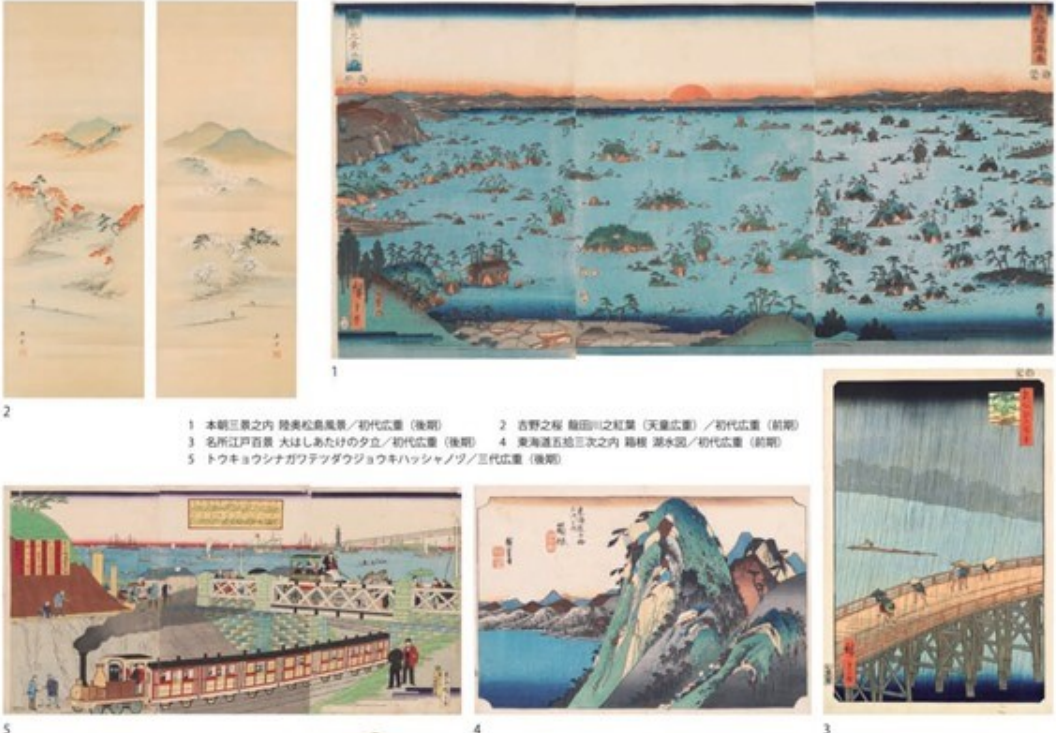
1 本朝三景之内 陸奥松島風景 / 初代広重（後期） 2 吉野之程 難田川之紅葉（天童広重） / 初代広重（前期） 3 名所江戸百景 大はしあたけの夕立 / 初代広重（後期） 4 東海道五拾三次之内 箱根 湖水図 / 初代広重（前期） 5 トウキョウシナガワフツダウジョウキハッシャノツ / 三代広重（後期）

〒986-0032 宮城県石巻市開成1-8 TEL.0225-98-4831 企画・監修 広重美術館 / 共催 東京海上科学博物館 後援 国土交通省、国土交通省東北支庁、NHK 東北放送、NHK 石巻放送局、石巻市、石巻市教育委員会、東北新聞社、東北放送、石巻市立博物館（石巻市はく）、石巻日日新聞社、ラジオ石巻 FM76.4、一般社団法人石巻観光協会、一般社団法人石巻観光推進機構