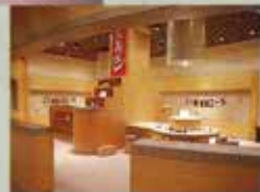
プレイ・シアター