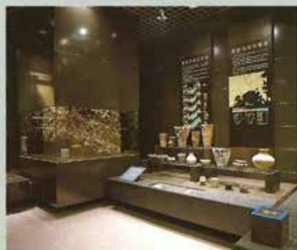
原始古代の漁労文化