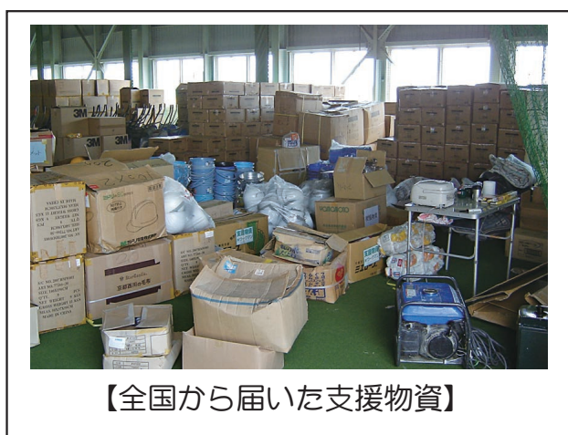
【全国から届いた支援物資】