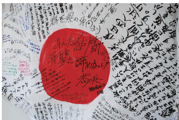
【全国各地から寄せられた心のメッセージ】