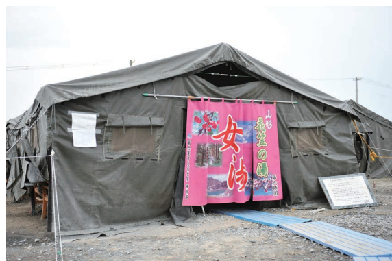
【自衛隊によるお風呂の支援】

○当時を知る人に、どんな支援があったか、どのような支援がうれしかったか聞いてみよう。