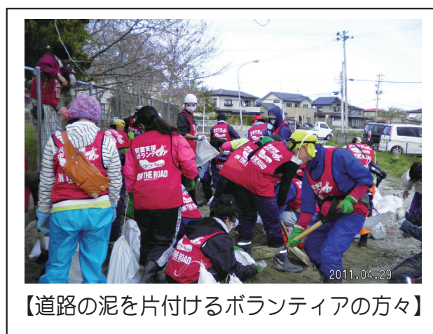
【道路の泥を片付けるボランティアの方々】