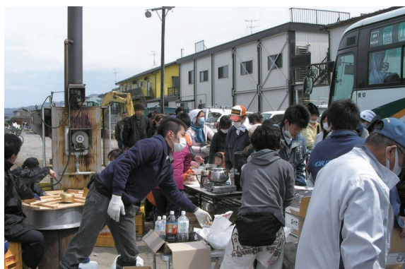
【炊き出しを行うボランティア団体】