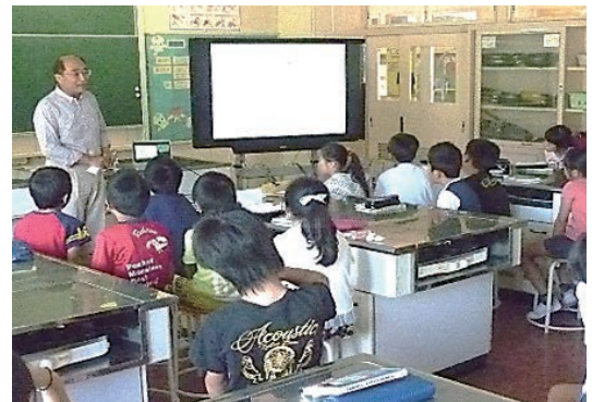
だい がく こう し まね じ しん つ なみ し く み ▲大学から講師を招いて地震・津波の仕組みや 身の守り方を学ぶ