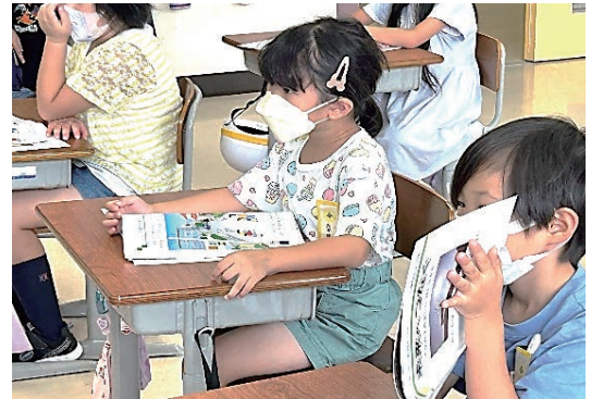
ぼう さい ふく どく ほん かつやう ぼう さい がく しやう ▲防災副読本を活用した防災学習