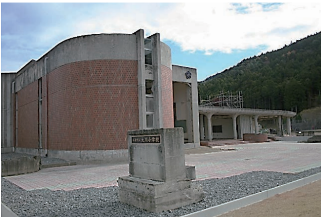
▲いのちについて考える「震災遺構大川小学校」