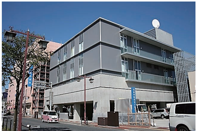
▲防災拠点として建設された「防災センター」