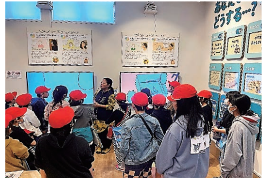
しん さい でんしやう し せつ まな こ ▲震災の伝承施設で学ぶ子どもたち