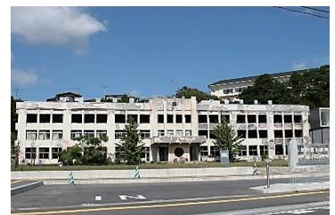
◀震災の記憶と教訓を伝える「南浜津波復興祈念公園」と「震災遺構門脇小学校」