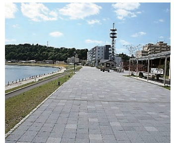
▲「いしのまき元気いちば」や「かわまちオープンパーク（遊歩道・堤防）」が整備された旧北上川沿い