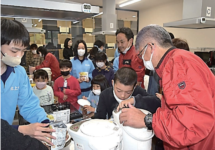
こ とし かた まいとし おお し めん さん か ▲子どもからお年よりの方まで、毎年多くの市民が参加する 「石巻市総合防災訓練」