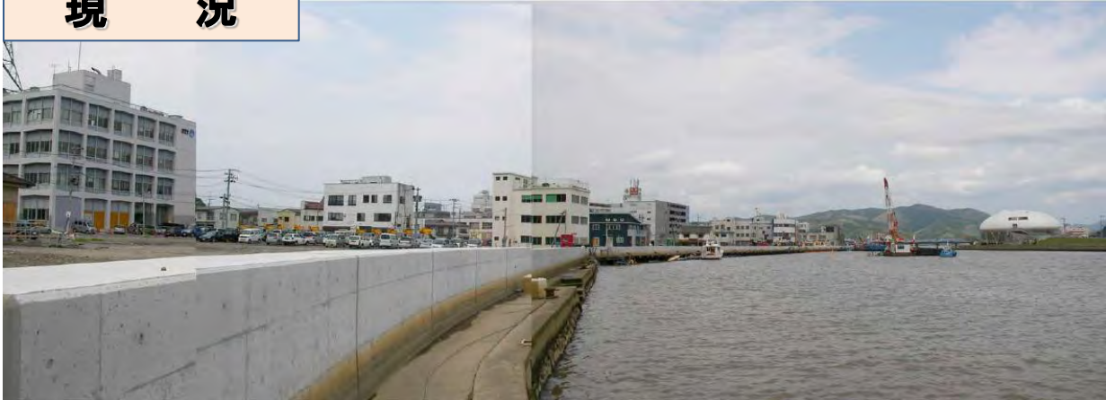
門脇町河岸側から右岸上流を望む