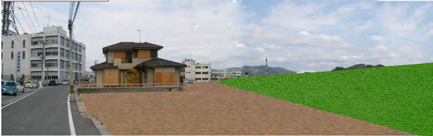
区間③ 河川堤防イメージ

※現時点でおおまかに河川堤防の大きさをイメージしたものであり、実際の整備とは異なります。