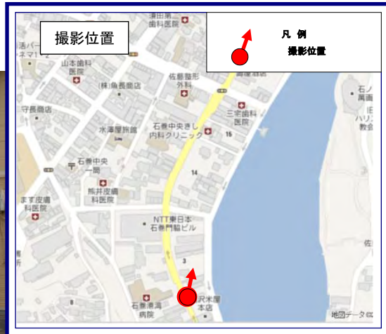
門脇町街側から望む