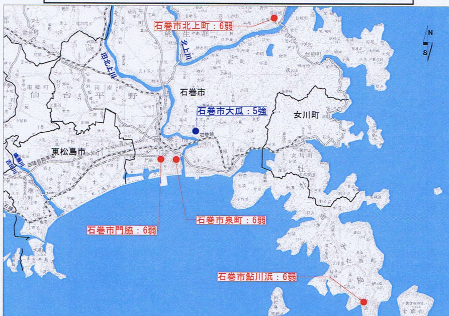
図 2-1 推計震度分布図