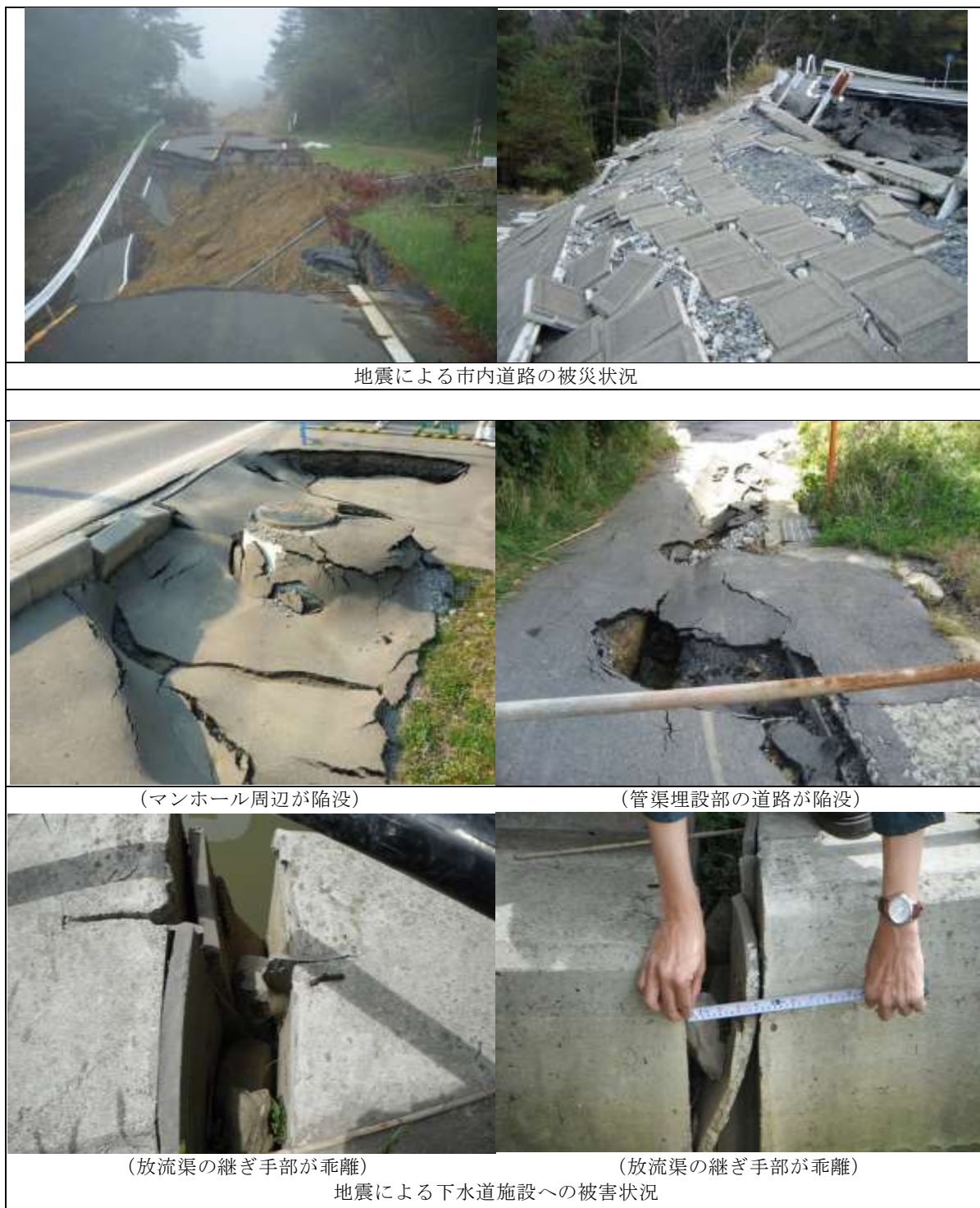
図 2-2 地震による市内の被害状況

地震に伴い、市内各所で建物の倒壊や崖崩れなどが起こりました。また、下水道施設も液状化によるマンホールの隆起や管渠の変形など、各処理区で被害を受けました。