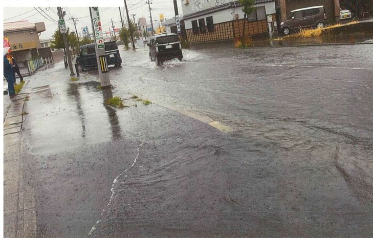
冠水・浸水の状況写真